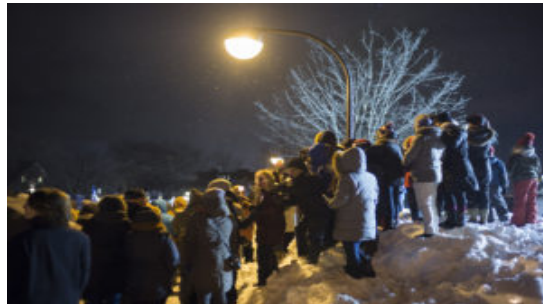
Un ribete de odio se agita mientras Canadá acepta a los migrantes