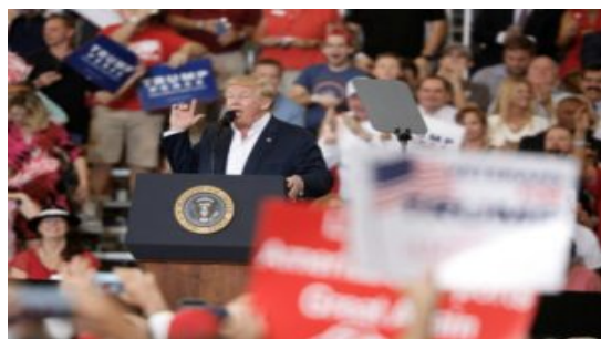
Trump alude a incidente terrorista inexistente en Suecia