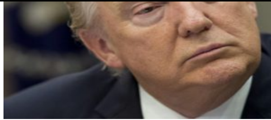
Trump recibe a Netanyahu y no insistirá en la solución de dos Estados

El sistema de cuotas fue reestructurado en 1965 y ahora las leyes de inmigración son más imparciales. Con