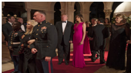
Melania Trump reaparece, y viste prendas europeas