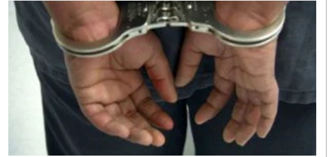
Gözaltılar İçin Spor Salonu Hazırladılar...