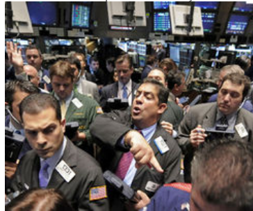
Les traders bientôt en short

Plus au chaud, et pourtant plus pauvre: s'il continue à ce rythme, le réchauffement climatique pourrait non seulement ruiner l'environnement, mais aussi l'économie mondiale. Et bien plus qu'on ne le pensait, comme le révèle une étude publiée mercredi 21 octobre dans la revue Nature .